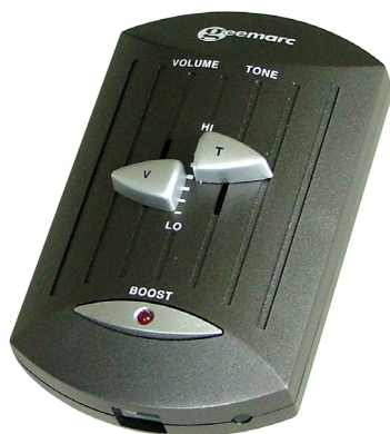
CLA40 Art nr 273050